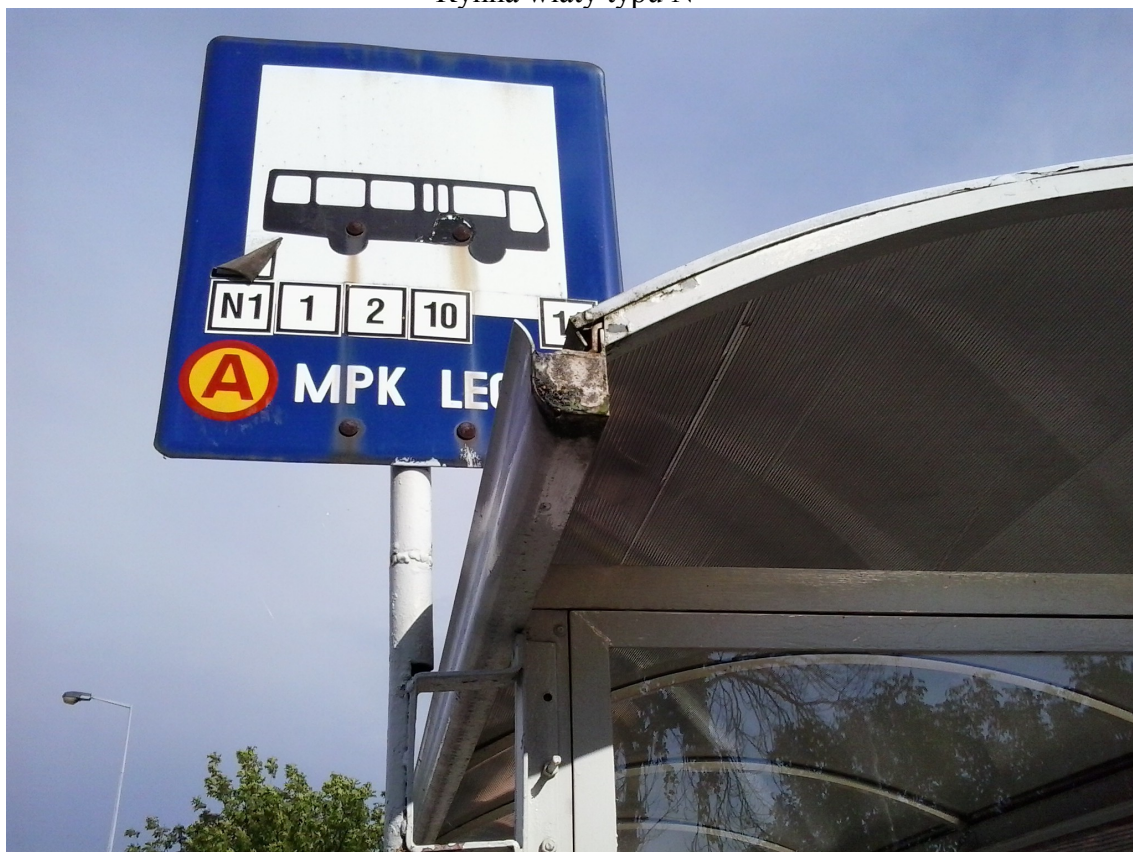
Miejsce przymocowania do wiaty typu R, G, H Wiata typu G