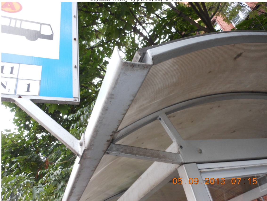
Rynna wiaty typu B

Widok z boku rynien w wiatach: Rynna wiaty typu A, K, O i M