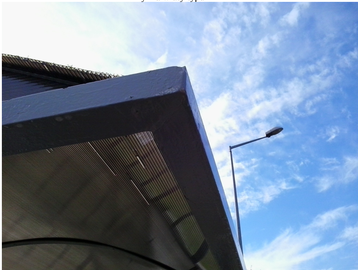
Rynna wiaty typu J